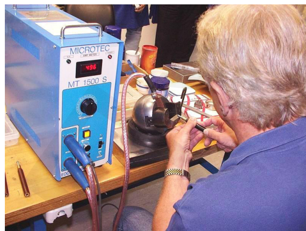
Аппарат безопасен и работает при малом напряжении