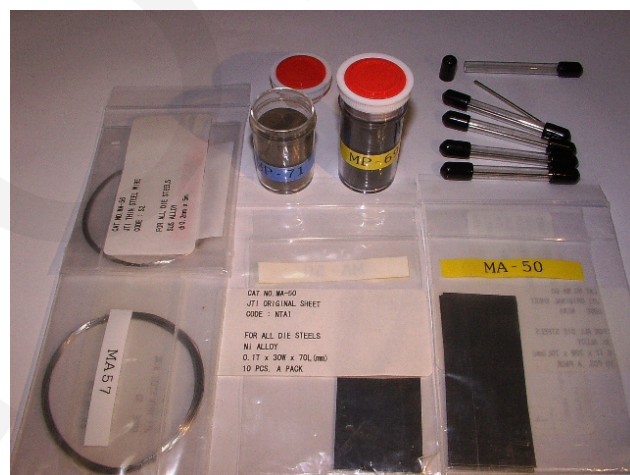
Расходные материалы - проволока, порошок, полосы.

Стальной порошок сам «прилипает» к магнитному электроду и попадает в зону ремонта.