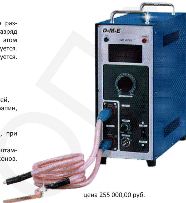
цена 255 000,00 руб.

ДЛЯ ЗАПРОСА РАСХОДНЫХ МАТЕРИАЛОВ И ЭЛЕКТРОДОВ СМОТРИТЕ РУКОВОДСТВО MT1500-2500 И ПОЛНЫЙ КАТАЛОГ D-M-E